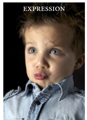
Portraits depuis notre studio